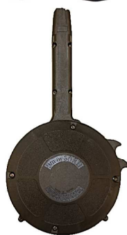
50 Schuss, 9x19, Artikelnummer: 19.850