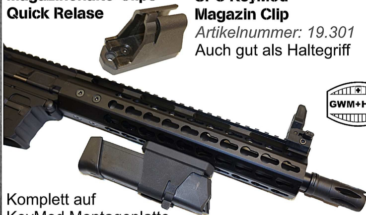
Komplett auf KeyMod Montageplatte

Artikelnummer: 19.302 für den CBS Hinterschaft