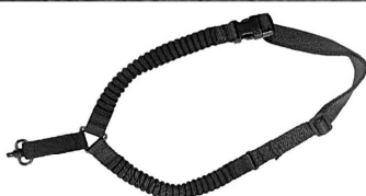
OPS Rimen + PBSS One Point Sling Artikelnummer: 15.411