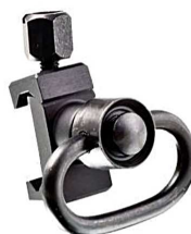
SPS + PBSS für Picatinny Artikelnummer: 11.408