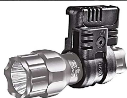
PLS1 Lampenhalter schwarz khaki / sand oliv/grün Artikelnummer: 11.406