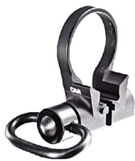
OPSMP QD Mount Artikelnummer: 15.408