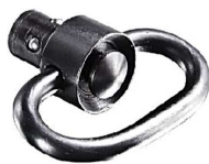
PBSS Rimenhalter Artikelnummer: 15.407