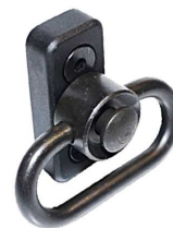
PBM + PBSS für Keymod Artikelnummer: 15.409