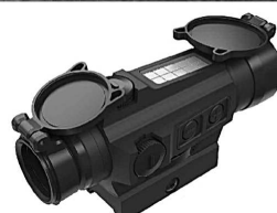
HOLOSUN Red Dot HS502C-U Artikelnummer: 15.412