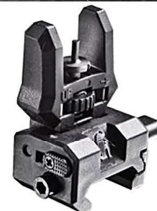
FRS + FSS Artikelnummer: 11.605