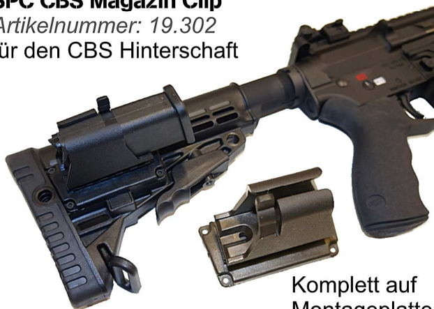
Komplett auf Montageplatte